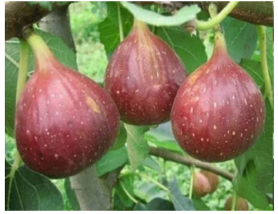
पचन महत्त्वपूर्ण भूमिका बजावते. अंजीर आतड्यांचे आरोग्य राखण्यास मदत करतात आणि शरीरातील विषारी पदार्थ काढून

पचनसंस्था निरोगी ठेवते : वजन कमी करण्यात चांगले