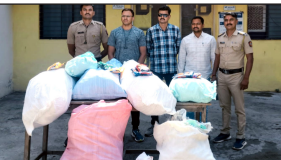
नॉद करण्यात आला आहे. सदर गुन्हा भारतीय न्याय संहितेच्या कलम १२३, २२३, २७४, २७५ अन्वये दाखल करण्यात