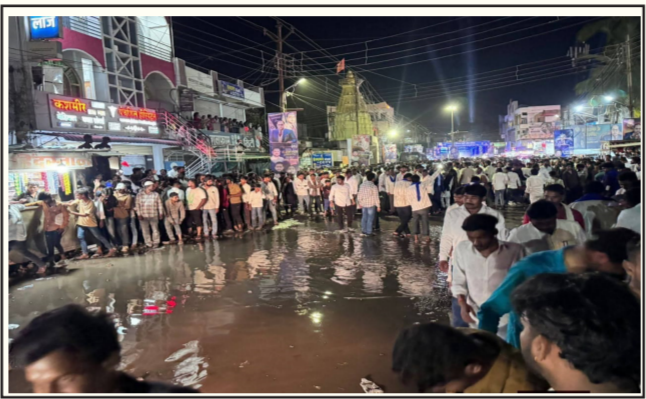
झाले होते. याचवेळेस बीड नगरपालिकेचा भोंगळ कारभार आणि नगराध्यक्षांचा बेजबाबदारपणा दलित टाकून नगरपालिकेला जयंतीमध्ये येणाऱ्या जाणाऱ्या लोकांना खाली पाडायचे होते का? आणि लोक

गेल्या अनेक वर्षांपासून जयंती साजरी होतेय. मिरवणुका निघताहेत. लोक आनंदोत्सवाने नाचतात पण असे घडले नाही. मात्र तुम्ही नगराध्यक्ष असताना तुमचा बेजबाबदारपणा दलित समाजाच्या मुळावर उठला नाही का? असा प्रश्न उपस्थित होतो. त्यामुळे केवळ नोटीस देऊन त्याचा खुलासा मागवून दलित समाजातील मनातील रोष आणि झालेला अवमान हे कधीही माफ करण्यासारखे नाही. त्यामुळे नोटीस कशासाठी द्यायची हिंमत असेल तर या तीन कर्मचाऱ्यांना निलंबित करून दाखवा तसेच दलित समाजासह डॉ.बाबासाहेब आंबेडकरांना मानणाऱ्यांच्या मनातील राग कमी होईल अशी चर्चा होत आहे.